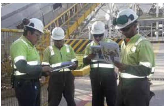
Colaboradores de Quito Norte se prestan al uso del Equipo de Protección Personal correspondiente a sus actividades.