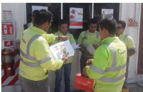
Todo el personal de Holcim Ecuador debe someterse a realizar los chequeos de prevención de riesgos antes de iniciar a sus actividades.

Dentro del desarrollo de las actividades se pudo contar con la participación de todos los colaboradores de la compañía, donde se hicieron propuestas de oportunidades de mejora tanto en los comportamientos al realizar una actividad como en las condiciones.