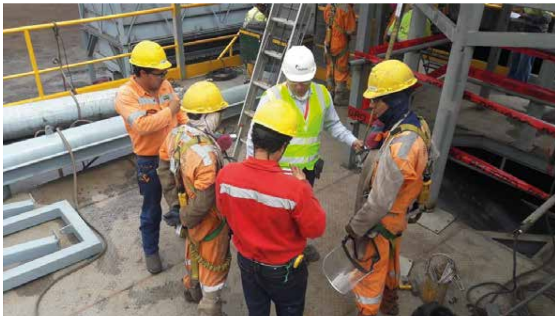
Las actividades relacionadas a la campaña "Yo me comprometo" se desarrollaron en todas las plantas Holcim a nivel nacional.

Los tres pilares buscan fomentar el liderazgo proactivo del líder y la disciplina operativa del operario.