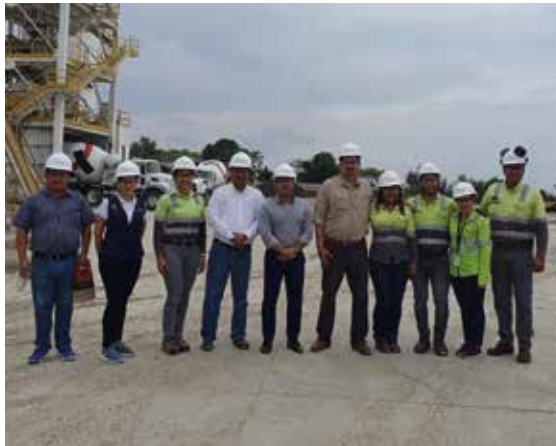
Personal de Holcim Ecuador de la planta Manta recibió al ministro del ambiente, Marcelo Mata.

Holcim Ecuador acogió a Marcelo Mata, Ministro del Ambiente, en nuestra Planta Manta