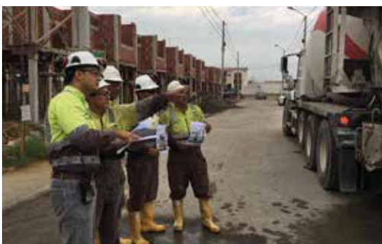
Conductores de mixer de la planta San Eduardo efectúan las revisiones de los vehículos.