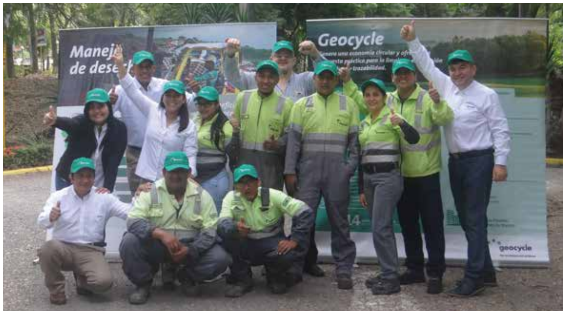
Parte del equipo de Geocycle dio inicio a la Geocycle Week el pasado 10 de junio.

Desarrollamos en cooperación con el equipo de marketing el concurso denominado "Tómame una selfie en tu lugar natural favorito". El concurso consistió en invitar a colaboradores de Holcim, clientes de los distintos servicios y soluciones y al público en general a que adjunte una fotografía suya