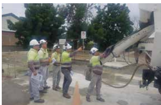
Operarios de mixers de la planta Manta realizan un chequeo en conjunto de las unidades antes de iniciar sus recorridos.