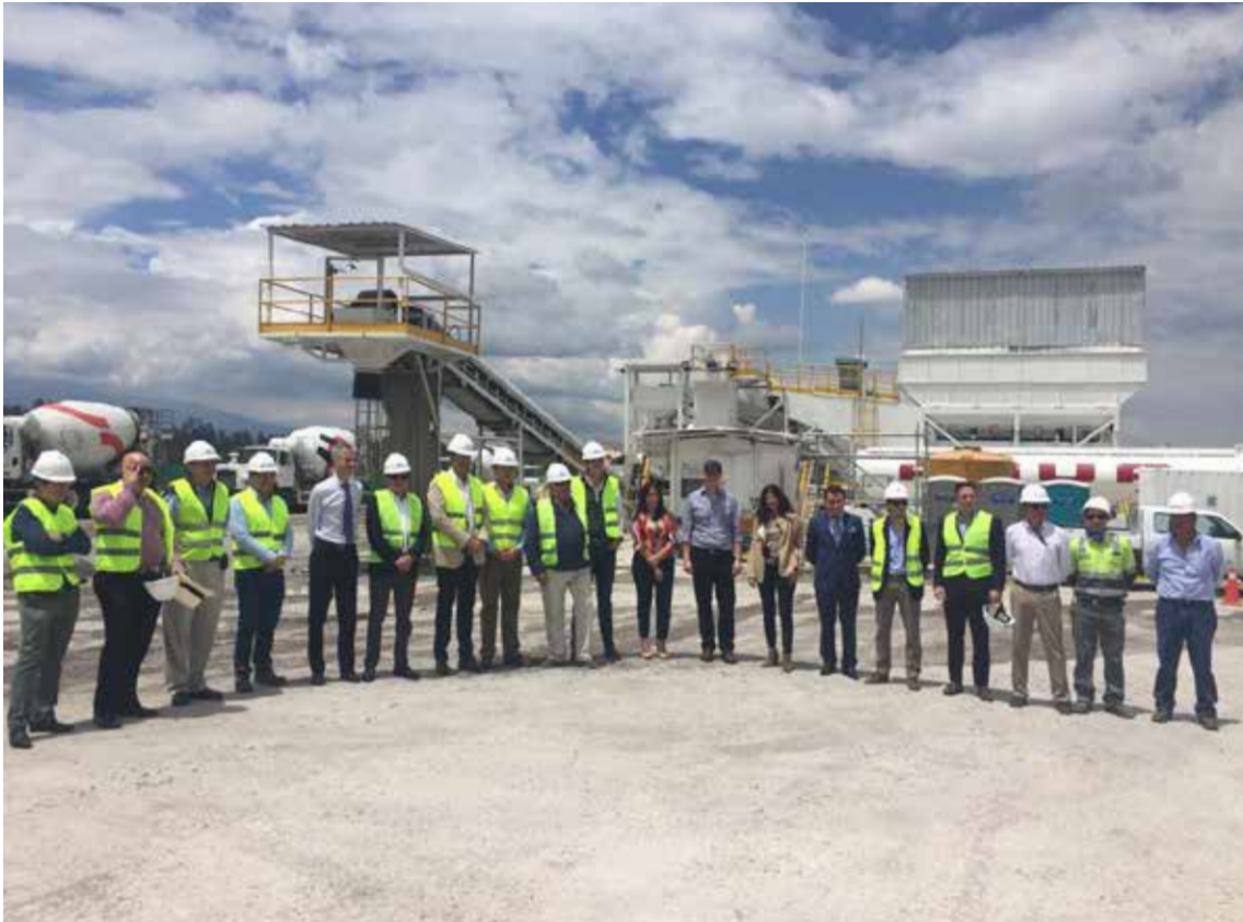
Visita de los inversionistas y accionistas a la planta Itulpark

El nuevo Centro Logístico Itulpark es nuestra nueva y tercera planta de operación de concreto en Quito, la cual está ubicada en Pifo, proyecto que posee una extensión de 150,000 m 2 , de los cuales 20,000 pertenecen a la primera etapa que aún se está desarrollando. Esta locación fue elegida estratégicamente para que las industrias operen con máxima eficiencia y nos permita fortalecer nuestra presencia en los mercados del sector,