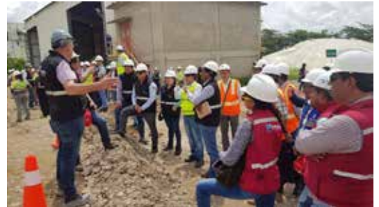
Demostración del proceso completo de la estabilización de suelos

Holcim ratificando su apuesta por la innovación, realizó el Seminario Internacional de Bases Estabilizadas con Cemento, del 18 al 21 de febrero en las ciudades de Guayaquil y Quito, donde contamos con la presencia de expositores nacionales e internacionales y 250 participantes, quienes pudieron