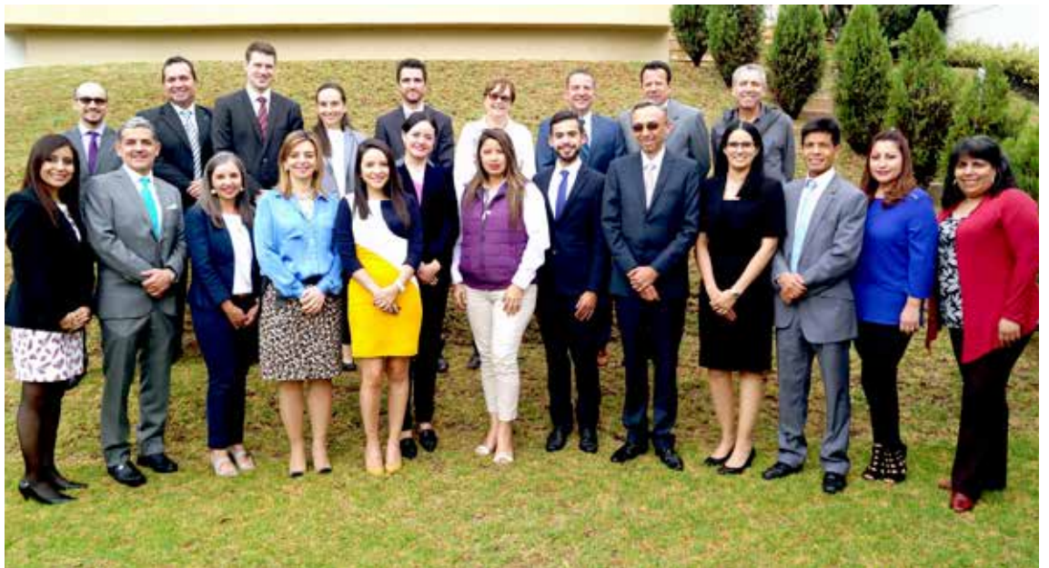
Representantes de la embajada y de las empresas que conforman la Alianza Suiza

La Fundación Alianza Suiza es el producto de una alianza de Responsabilidad Social Corporativa de las empresas suizas: ABB, Holcim, Nestlé, Novartis, Roche y Sika, avalados por la Embajada de Suiza en Ecuador.