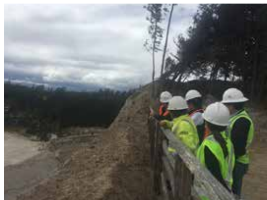
Participantes durante la demostración de nuestras buenas prácticas ambientales