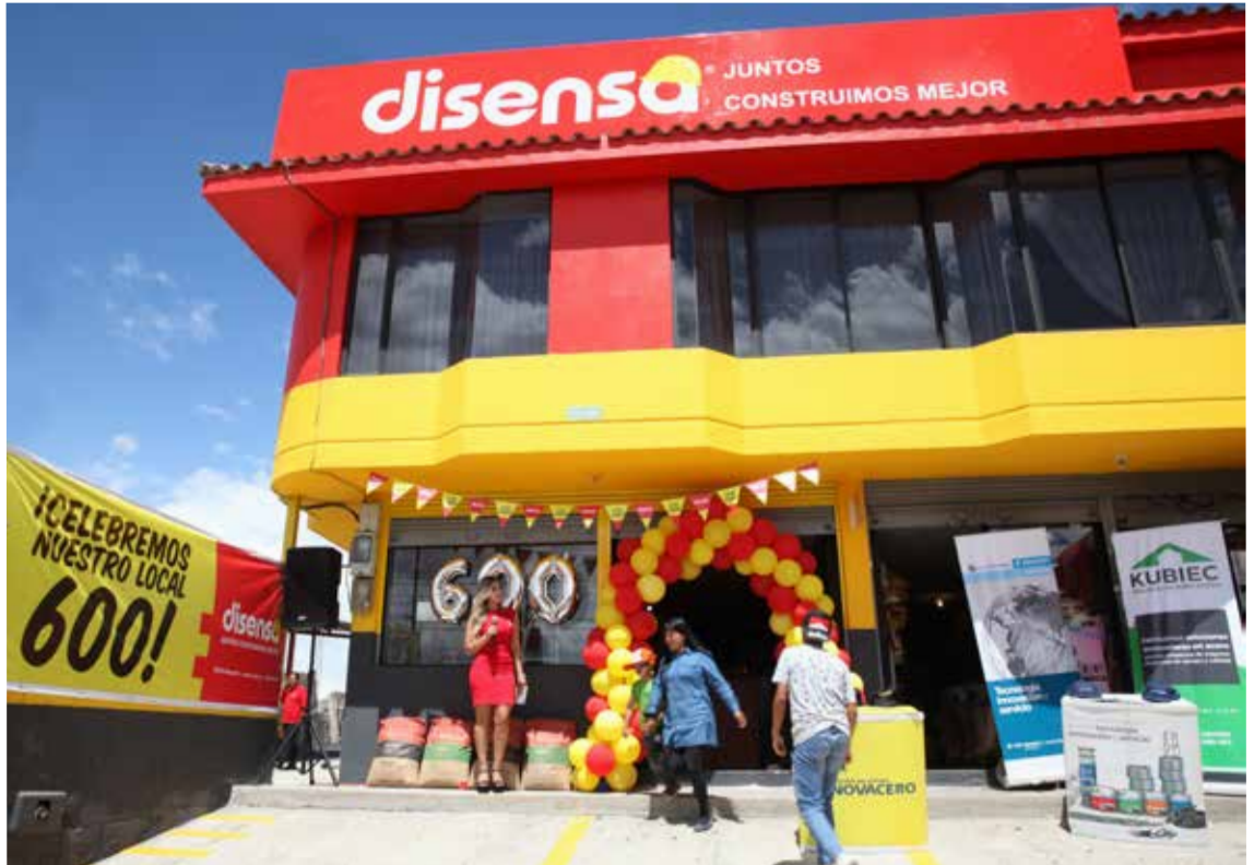
Inauguración de la franquicia número 600 en Quito

Disensa es una empresa nacida en Ecuador, pionera en crear el primer sistema de franquicias a nivel mundial destinadas a la venta de materiales de construcción de las marcas más reconocida y con mayor preferencia en Ecuador y Latinoamérica.