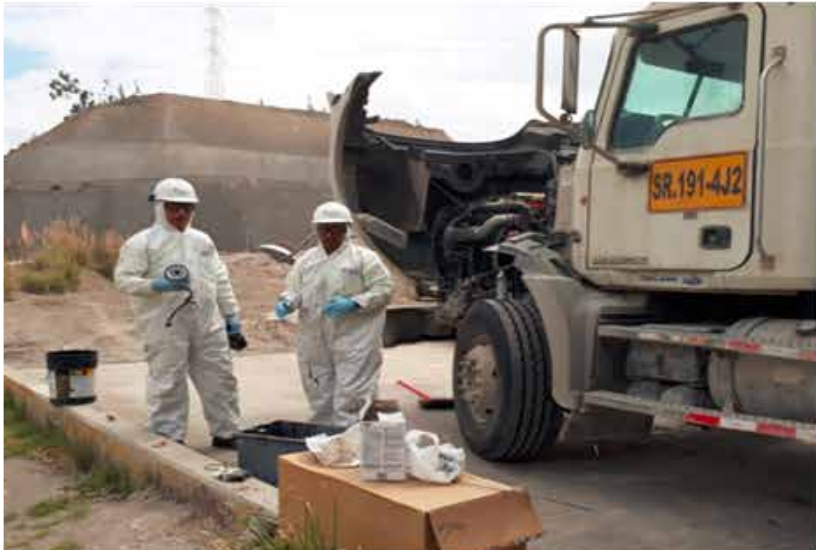
Mantenimiento de equipos pesados

En planta Latacunga colaboradores ampliaron sus frentes de trabajo, desenvolviéndose en diferentes áreas.