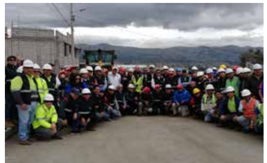
Participantes del seminario y autoridades del GAD Cotopaxi en la primera etapa de vía estabilizada con Cemento

El GAD Cotopaxi con el soporte técnico de Holcim Ecuador, inició la primera etapa en trabajos de mejoramiento vial en barrios rurales de Latacunga, con la meta de mejorar las condiciones viales del sector. Brindamos la solución Holcim Base Vial para estabilización de suelos, la cual es, resistente, aminora costos y optimiza recursos reutilizando el suelo existente; dejando un impacto positivo en la sociedad, razón por la cual, próximamente iniciaremos un segundo proyecto a nivel provincial, afianzando nuestra apuesta por la construcción de comunidades sostenibles.