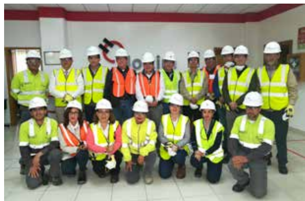
Representantes de las compañías participantes en las instalaciones de la planta Latacunga

Las compañías participantes fueron: Cedal, Novacero, Molinos Poultier, Alcalisa, Alcopesa, Cereales la Pradera, Ecarini, Provefrut, Panecons y Licorec; quienes fueron testigos de nuestras buenas prácticas ambientales y nuestros altos estándares de seguridad con los que trabajamos.