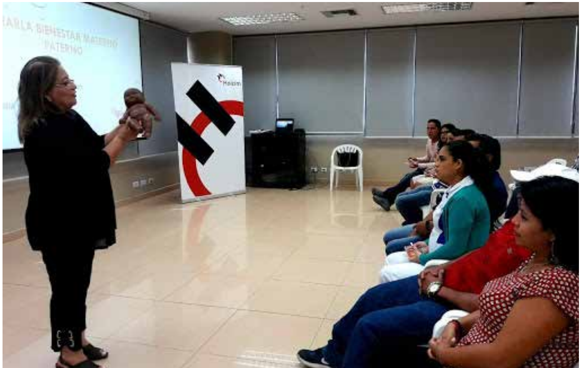
Durante la demostración de los cuidados que se le deben dar a los neonatos

Holcim Ecuador, a través del programa de Bienestar Materno paterno “Por una nueva vida a quien amar” demuestra ser una empresa socialmente responsable, preocupada y comprometida en generar espacios de encuentro.