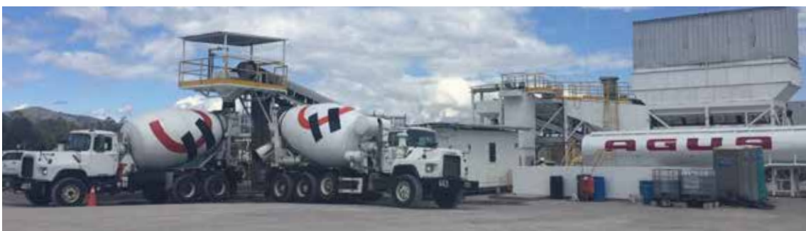
Cargando los primeros mixers de la planta Itulpark

como: Sangolqui, Tababela, Yaruqui, Checa, El Quinche, Puembo, Tumbaco, Cumbaya y Pifo. Este Centro, al poseer la más moderna tecnología, se impulsa como una solución para las industrias y servicios logísticos, además, brinda soluciones personalizadas a todos nuestros clientes, afianzando nuestra apuesta por la construcción del crecimiento de nuestro país.