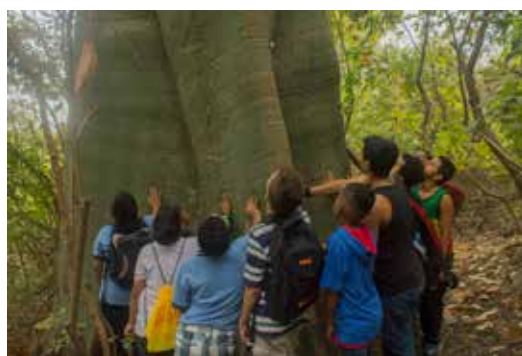
Niños observando un árbol endémico durante el recorrido en el Bosque Protector

Holcim Ecuador comprometido con el desarrollo sostenible, aporta al cuidado, protección y manutención del Cerro Blanco, el bosque seco tropical más grande de Guayaquil, ubicado en el km. 16 de la Vía a la Costa. La reserva tiene una extensión aproximada de 6.078 hectáreas, y posee una gran diversidad de flora y fauna, al ser hogar de más de 700 especies de plantas vasculares, de las cuales el 20% son endémicas, y hábitat de miles de especies, entre las que destacan: jaguares, monos aulladores, anfibios y reptiles; además, es considerado Área de Importancia para la Conservación de Aves (AICA) por ser hogar de 221 especies; entre ellas el Papagayo de Guayaquil que se encuentra en peligro de extinción.