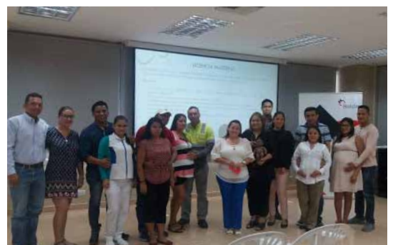
Colaboradoras y esposas de colaboradores en estado de gestación que asistieron a la charla Materno Paterno “Por una vida a quien amar”

Es importante resaltar que esta iniciativa nace del Programa Bebé Holcim que está vigente desde hace 7 años y aporta valor a nuestra propuesta como empleador.