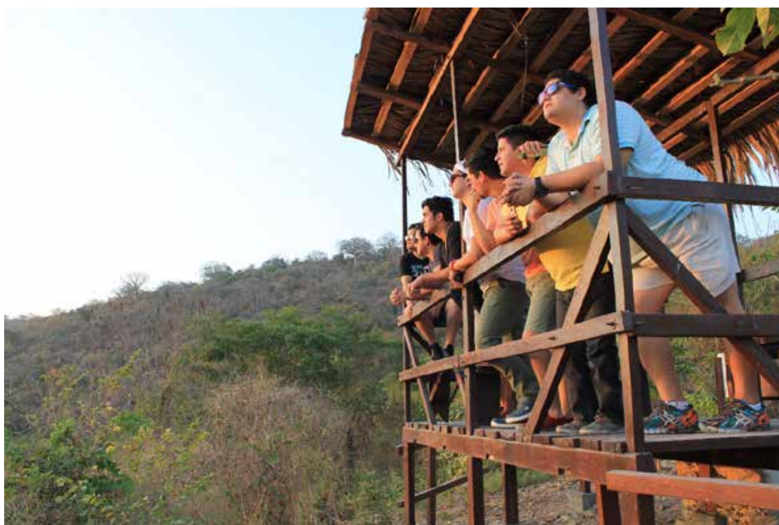
Turistas nacionales en el mirador de Cerro Blanco

Holcim Ecuador comprometido con el desarrollo sostenible, aporta al cuidado, protección y manutención del Cerro Blanco, el bosque seco tropical más grande de Guayaquil, ubicado en el km. 16 de la Vía a la Costa. La reserva tiene una extensión aproximada de 6.078 hectáreas, y posee una gran diversidad de flora y fauna, al ser hogar de más de 700 especies de plantas vasculares, de las cuales el 20% son endémicas, y hábitat de miles de especies, entre las que destacan: jaguares, monos aulladores, anfibios y reptiles; además, es considerado Área de Importancia para la Conservación de Aves (AICA) por ser hogar de 221 especies; entre ellas el Papagayo de Guayaquil que se encuentra en peligro de extinción.