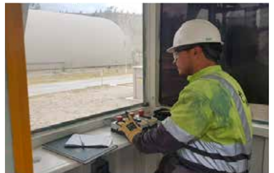
Hombre de área en despacho y materias primas