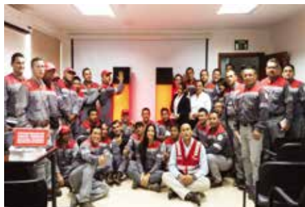
Lanzamiento del Programa de voluntariado 2017, Manta.