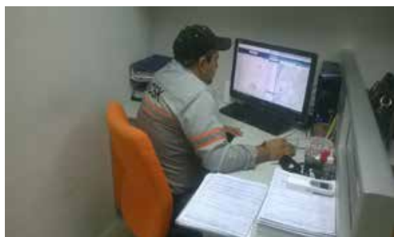
Central de monitoreo en Consekorp.

Control en excesos de velocidad (reducción de accidentes y multas), control de fatiga, rutas y jornadas de trabajo.