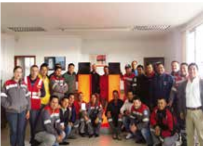
Lanzamiento del Programa de voluntariado 2017, Planta Cuenca