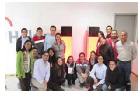
Lanzamiento del Programa de voluntariado 2017, Pta. Quito Norte.