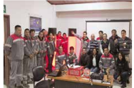
Lanzamiento del Programa de voluntariado 2017, Pta. Ambato.