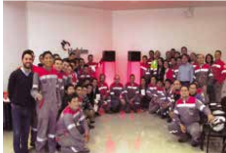
Lanzamiento del Programa de voluntariado 2017, Pta. Latacunga.