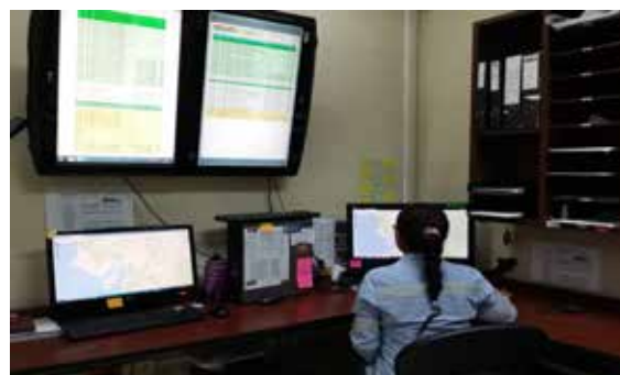
Central de monitoreo en Mamut Andino.