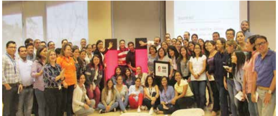
Lanzamiento del Programa de voluntariado 2017, El Caimán.

eventos tuvimos como bandera la U que simboliza la unión y trabajo en equipo. En El Caimán y en Planta Latacunga, el evento de lanzamiento, coincidió con la visita de Oliver Osswald. El, junto a Jorge Baigorri, aprovecharon para mostrar la importancia de estar comprometidos con un cambio social sostenible.