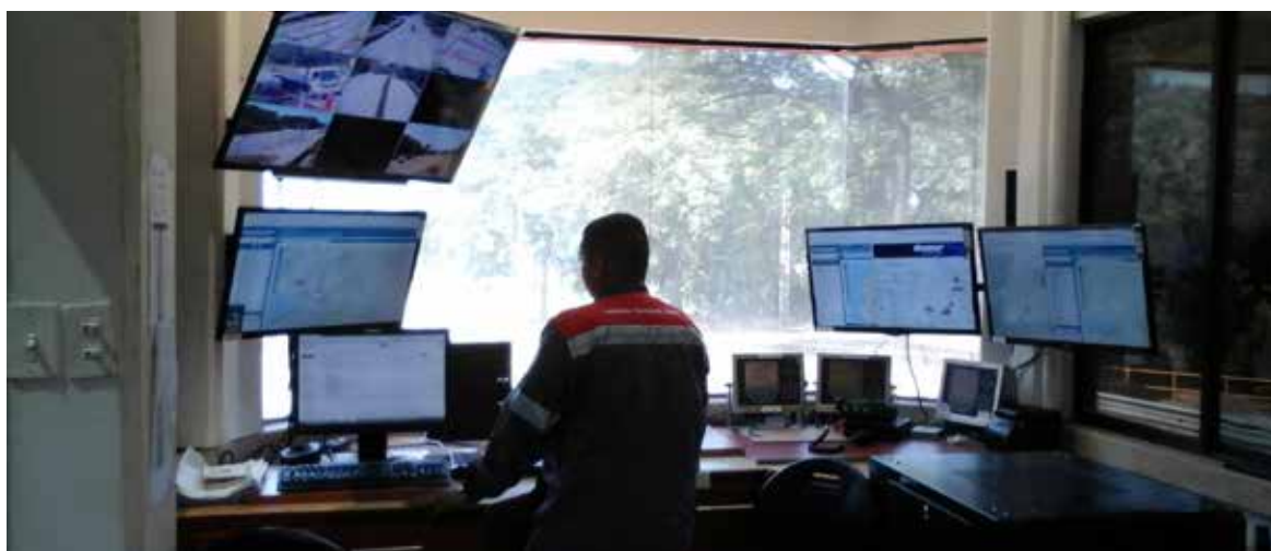
Central de monitoreo en Planta GU.

El 100% de nuestros contratistas de transporte cuentan con sistemas de GPS. Estos facilitan parámetros de trazabilidad, esenciales para administrar una empresa de transportes moderna y eficiente.