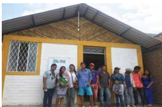
Una de las primeras casas entregadas con la ayuda del fondo Juntos por Ecuador.

El fondo Juntos por Ecuador ha logrado ejecutar y/o comprometer el 76% de los recursos recaudados. Apoya en la construcción de más de 80 viviendas, y dos colegios, beneficiando a cerca de 1,300 personas. Para más información visita nuestra página web www.juntosporecuador.com