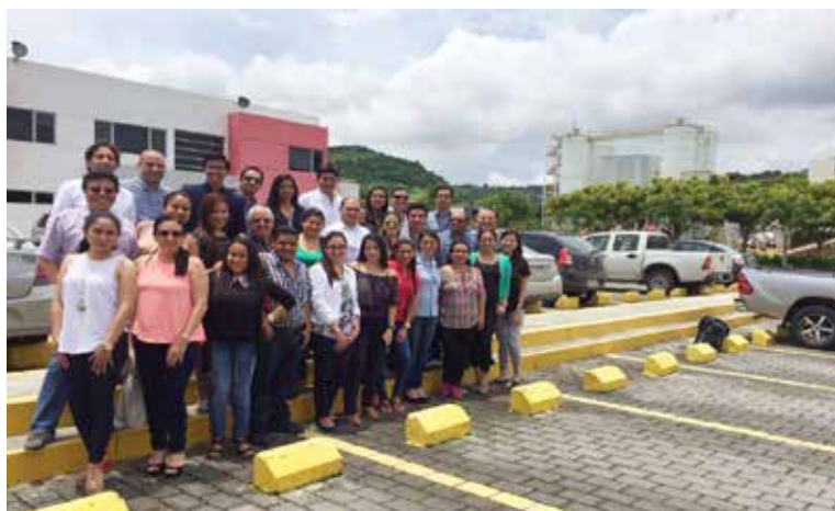
Equipo Comercial durante el taller VAP/VAS