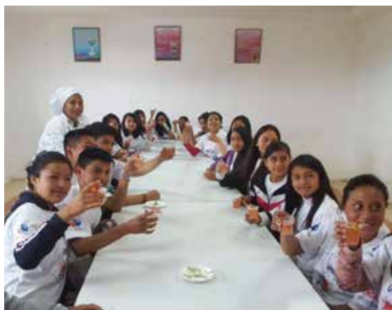
Los alumnos disfrutan de un refrigerio en medio de la jornada.

Fundación Holcim Ecuador, reforzando su compromiso con la educación de nuestros jóvenes, incentiva el interés de los estudios en los niños gracias a visitas a instituciones de nivel superior.