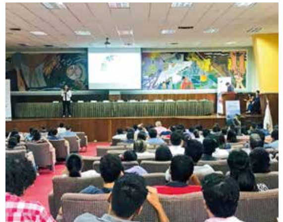
El Simposio Ambiental 2019 tuvo aproximadamente trescientos asistentes.

Se expusieron las prácticas que nos hicieron acreedores a la Ecoeficiencia, así como las soluciones avaladas con el sello Carbono Neutro. Además, mostramos los beneficios que Geocycle brinda mediante sus actividades de coprocesamiento.