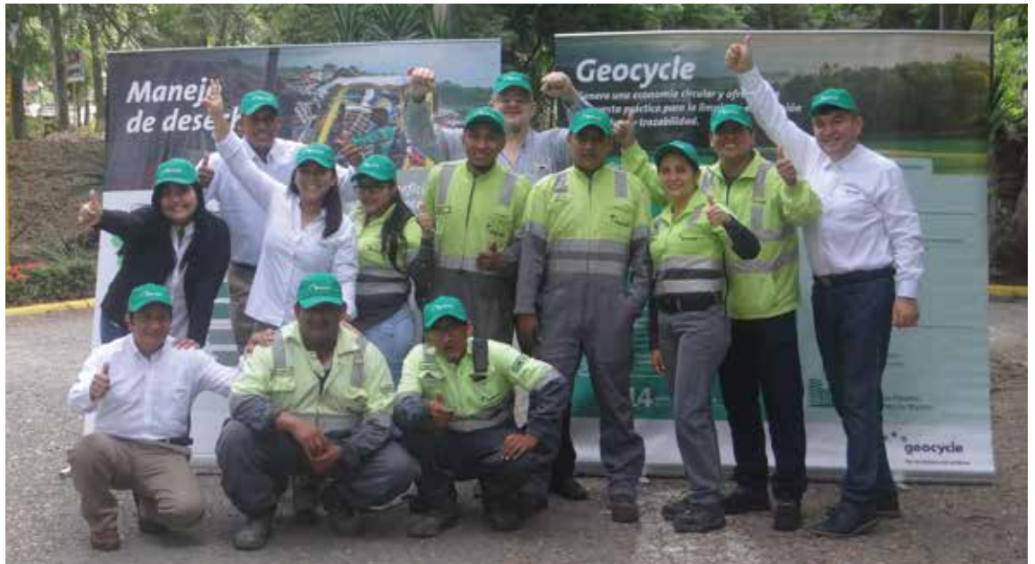
Parte del equipo de Geocycle dio inicio a la Geocycle Week el pasado 10 de junio.

Desarrollamos en cooperación con el equipo de marketing el concurso denominado "Tómate una selfie en tu lugar natural favorito". El concurso consistió en invitar a colaboradores de Holcim, clientes de los distintos servicios y soluciones y al público en general a que adjunte una fotografía suya