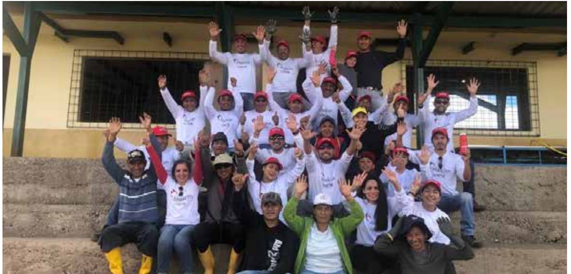
La integración entre voluntarios de Holcim y las comunidades es clave para alcanzar los objetivos de ambos.