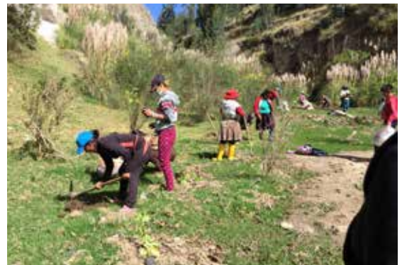
Alrededor de 1560 plantas fueron sembradas en las zonas destinadas a la reforestación.