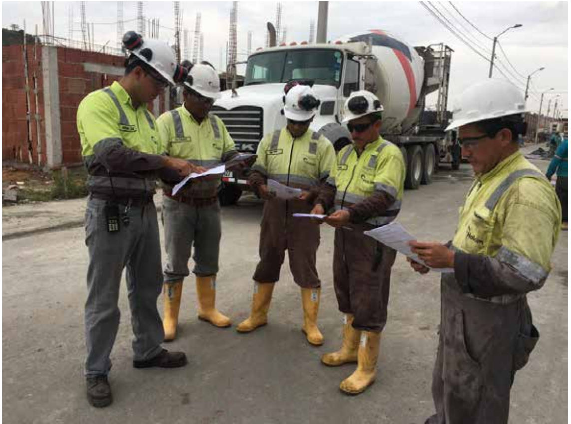
Los procesos de chequeo se llevan a cabo en todos los niveles operativos de nuestra compañía.

Esta iniciativa tiene como fin la concientización de los peligros a los que podemos exponernos los colaboradores en las distintas funciones que cumplimos dentro de la organización.