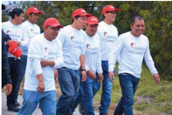
Una de las cosas que destacamos de nuestro programa de voluntariado es la felicidad con la que laboran nuestros integrantes.