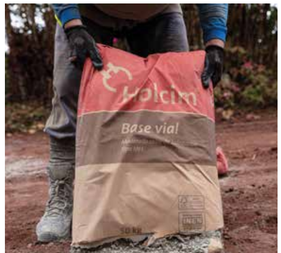
Base Vial es una solución enfocada para la construcción de vías a bajo costo.

De esta forma, reafirmamos nuestro compromiso en la lucha contra el cambio climático, construyendo nuevos caminos para alcanzar la preservación del planeta. Construimos crecimiento para el país.