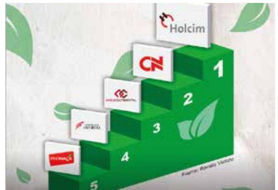
Este ranking fue realizado por Advance Consultora mediante encuestas telefónicas a expertos y consultores en temas ambientales.

Por esto y más, Holcim Ecuador tiene un compromiso firme con el ambiente.