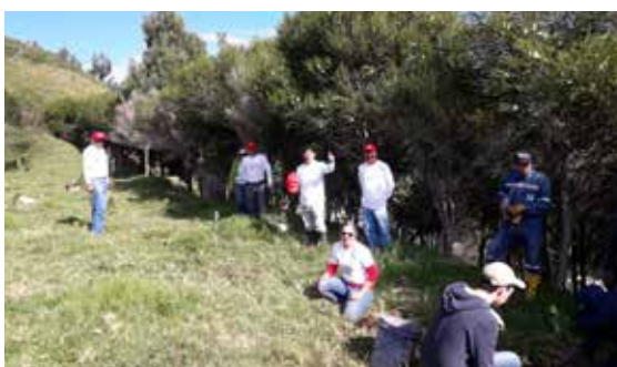
El equipo de voluntarios de la planta Pifo realizó la reforestación en la comunidad de Sigsipamba.

A su vez, la comunidad de Sigsipamba también fue beneficiada por nuestras labores de reforestación. El pasado 11 de mayo, aproximadamente 1700 árboles, entre acacias, laurel, pumamaqui y alisos, fueron plantados en La Moya, Sigsipamba y Cuniburo, donde cerca de tres mil habitantes de las zonas recibirán el impacto positivo del rescate de áreas aptas para el surgimiento de la flora.