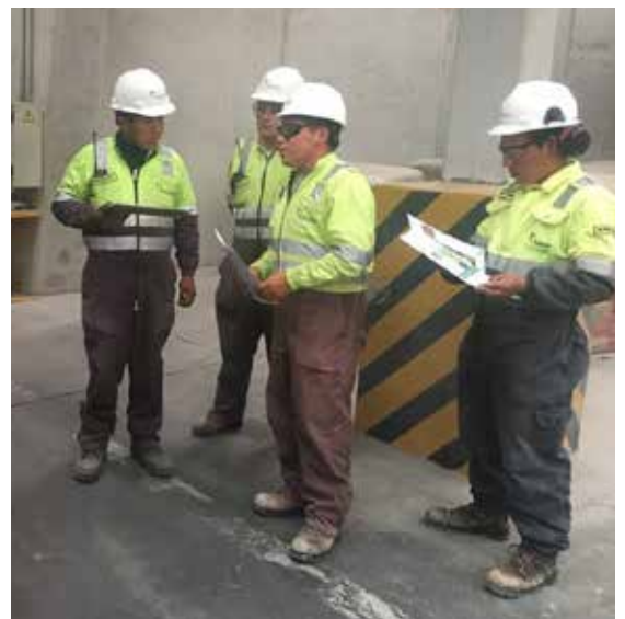
Los colaboradores y líderes tuvieron la oportunidad de chequear los procesos de revisión y realizar observaciones.