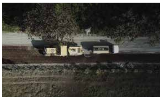
El tren de estabilización, una vez en marcha, permite rendimientos acelerados en la construcción de las vías.

La coordinación en el retorno y disposición final de los desechos generados directamente al continente mediante un gestor ambiental, así como el empoderamiento, compromiso y pasión de la Gente Holcim, son algunas de las características que convirtieron a este proyecto en un ícono de sostenibilidad a nivel global.