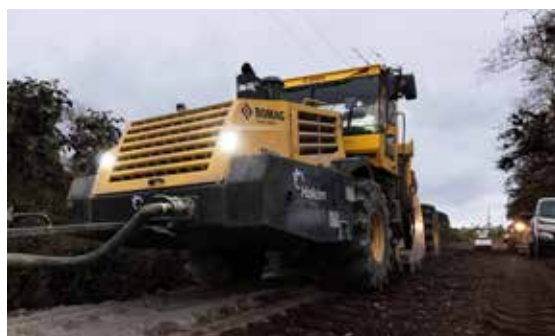
Un factor diferenciador de nuestros procesos de pavimentación es el uso de equipos de última tecnología.