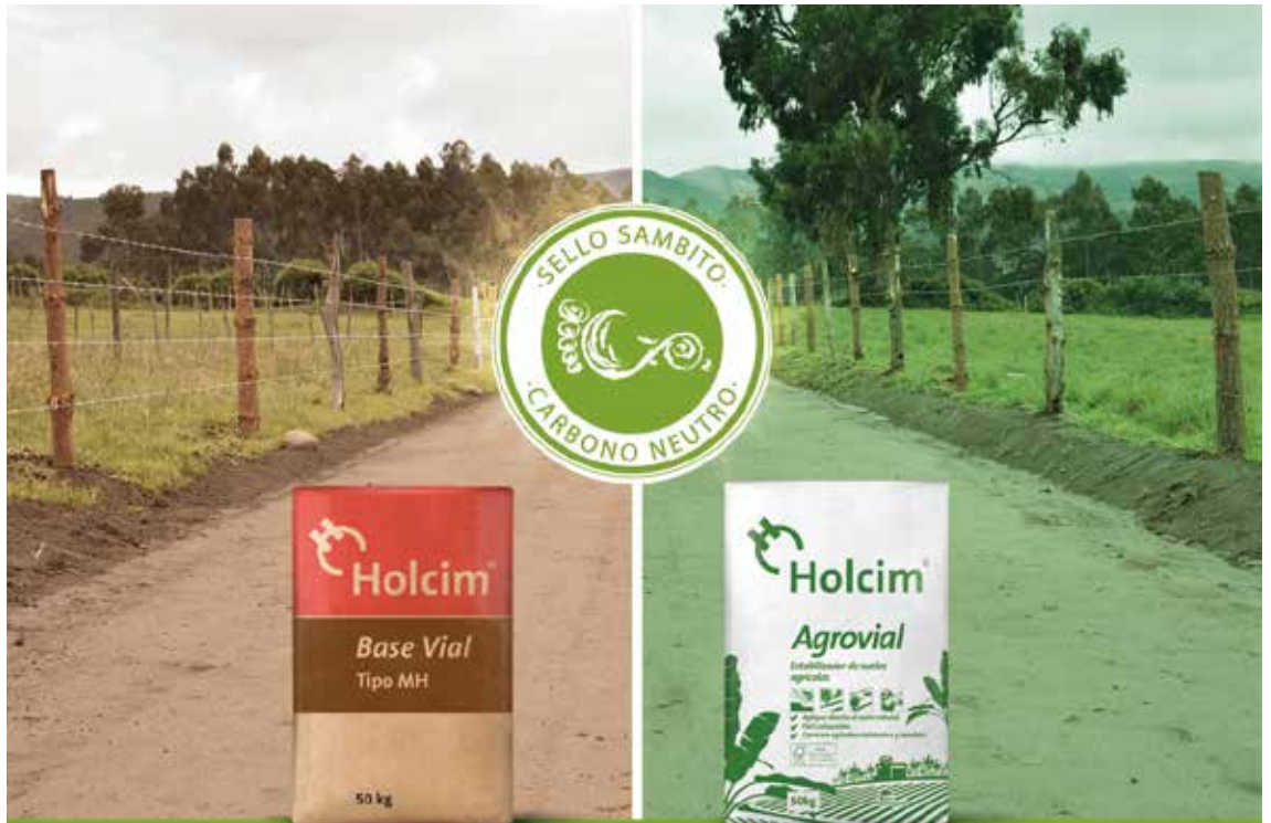
El certificado Carbono Neutro fue otorgado por la compañía Sambito, enfocada en brindar soluciones ambientales.

Ofrecemos a nuestros clientes soluciones sostenibles. Holcim Ecuador cuenta con las primeras soluciones carbono neutro en el país.