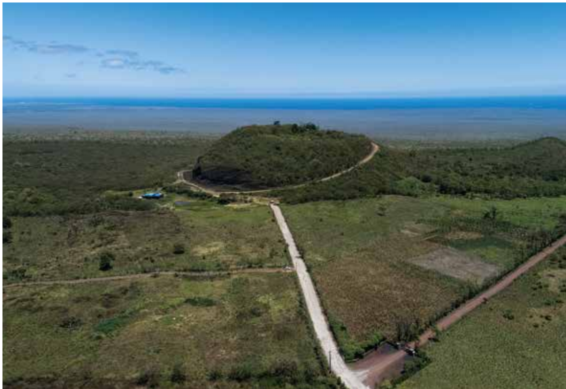
Los caminos en el archipiélago de Galápagos quedaron aptos para el tránsito vehicular.

Holcim Ecuador, juntando esfuerzos con el Gobierno del Régimen Especial de Galápagos, pudo llevar a cabo el proyecto de movilidad sostenible del archipiélago. La aplicación de 115 mil sacos de nuestra solución Holcim Base Vial, la reutilización de materiales pétreos existentes en las vías, el proceso controlado de estabilización de suelos con maquinaria de última tecnología y el traslado de 5750 toneladas de soluciones forman parte del gran proceso logístico que se tuvo que llevar a cabo para poder lograr, de manera responsable, la construcción de nuevas vías en zonas rurales de Galápagos.