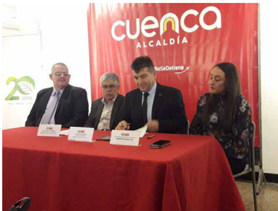
Directivos de la EMAC-EP y Holcim Ecuador firmando el convenio en beneficio de la comunidad.

Mediante esta alianza, Geocycle coopera a la prolongación de la vida útil estimada de los depósitos de desechos de ambas ciudades, reiterando su modelo de economía circular.