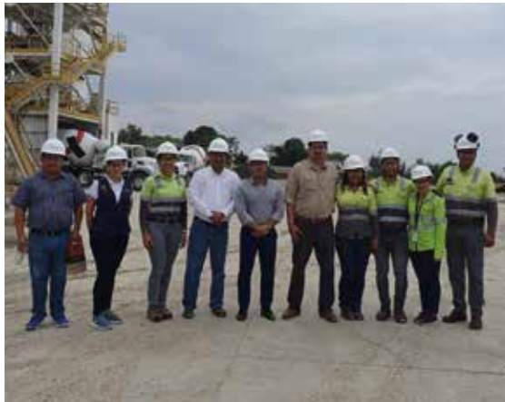
Personal de Holcim Ecuador de la planta Manta recibió al ministro del ambiente, Marcelo Mata.

Holcim Ecuador acogió a Marcelo Mata, Ministro del Ambiente, en nuestra Planta Manta