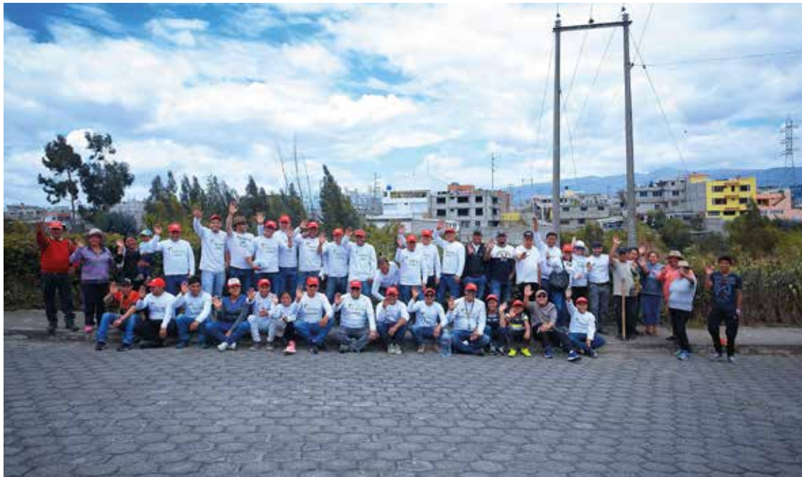
El equipo de voluntarios que participó junto a seis comunidades del cantón Latacunga.

La familia de voluntariado de Holcim Ecuador ha desarrollado varias acciones enfocadas en el cuidado ambiental en los alrededores donde realizamos nuestras actividades. El compromiso de Holcim Ecuador y sus voluntarios es fundamental para lograr generar una mayor concienciación en la sociedad realizando actividades de impacto directo.