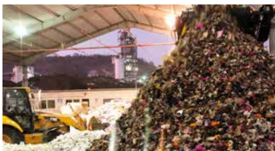
Geocycle se encargará de coprocesar aproximadamente 6800 toneladas de desechos de Cuenca y 1500 toneladas de Guayaquil.

coprocesamiento de desechos. Gracias a este vínculo, firmado el pasado 6 de mayo, 6.864 toneladas anuales dejarán de ser enterradas en el relleno Pichacay. Holcim Ecuador, a través de Geocycle, sigue brindando soluciones ecoamigables para la conservación de nuestro planeta.