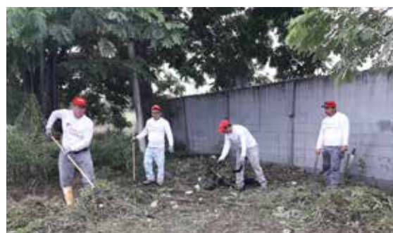
Los voluntarios también llevaron a cabo tareas de limpieza en los sectores visitados.