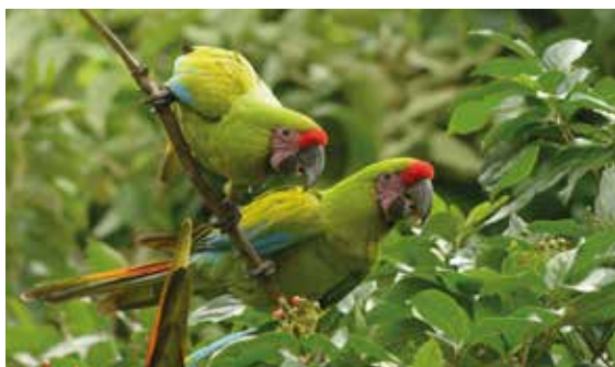
El Bosque Cerro Blanco es uno de los últimos espacios de Guayaquil donde habita el papagayo.

Las especies más emblemáticas de la reserva se enfrentan constantemente a amenazas. El bosque protector, en sus 6078 hectáreas de bosque seco tropical posee más de 700 especies de plantas vasculares, 54 especies de mamíferos. 24 especies de murciélagos y más de 240 especies de aves, además de ofrecer albergue a 22 especies de reptiles y 8 especies de anfibios.