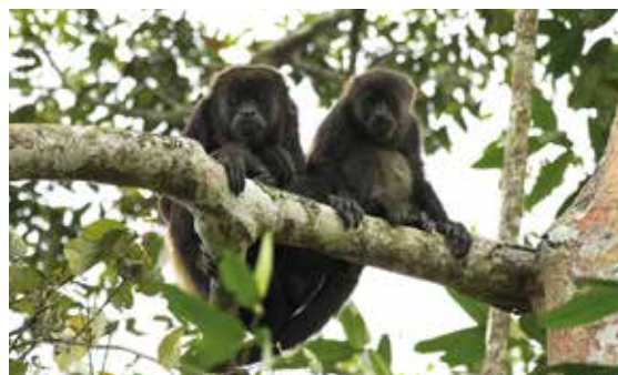
Los monos aulladores pueden emitir aullido que pueden ser escuchados hasta a ocho kilómetros de distancia.