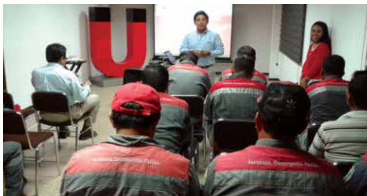
Lanzamiento del programa de voluntariado en planta Machala.