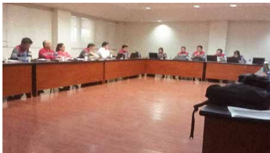
El objetivo estratégico de las operaciones de cemento es crear valor a nuestros clientes y el uso responsable de los recursos.

En Diciembre 2015 se diseñó la estrategia 30:30, enmarcada en el objetivo estratégico de las operaciones de cemento: Crear valor a nuestros clientes con una eficiencia operacional > 85%, enfocado en la mejora continua, el uso responsable de los recursos y con cero daño.