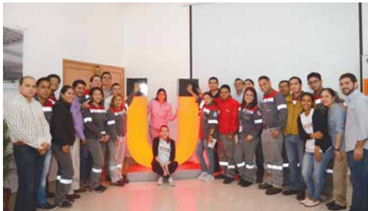
Lanzamiento de Programa de voluntariado en planta San Eduardo.