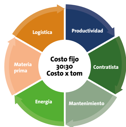
La estrategia 30:30 se fundamenta en aspectos relevantes que influyen significativamente en el costo de producción.

Luego de un seguimiento del progreso mensual, el resultado de la implementación de la estrategia 30:30 ha sido un éxito. Básicamente por lo que hasta el momento logramos. 1) Fomentar cultura H&S de cumplir, a vivir la seguridad. 2) Se simplificaron procesos y se fortaleció la colaboración entre las áreas. 3) El empoderamiento de los líderes en la estrategia en costos permitió mitigar el impacto de costos no presupuestados (e.g. precios de energía más elevados, nuevos impuestos y tasas municipales).