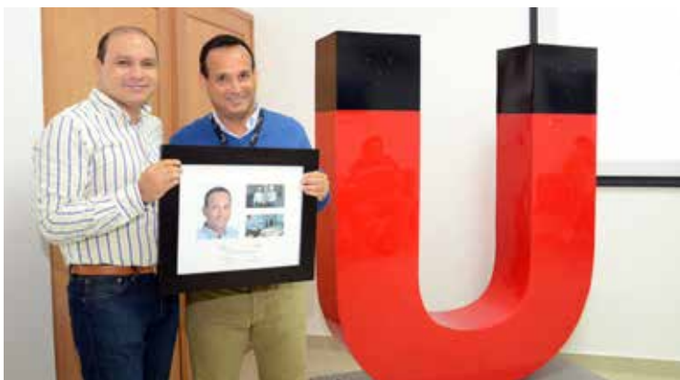
Reconocimiento a uno de los voluntarios con mayor participación en el 2016.