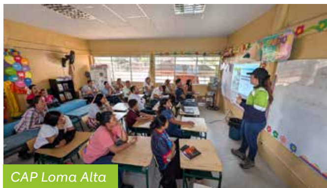
CAP Loma Alta

Contribuimos al desarrollo sostenible de las comunidades aledañas a las operaciones de Holcim en el país, mediante la ejecución de proyectos a corto, mediano y largo plazo concertados en consenso con la población y con visión estratégica, que apuntalen nuestras áreas y enfoques.