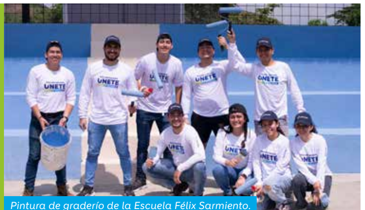
Pintura de graderío de la Escuela Félix Sarmiento.

Junto a nuestro equipo de voluntarios y los representantes de la comunidad Sabanilla, entregamos materiales y organizamos una minga para mejorar la infraestructura de las aulas y canchas deportivas de la Unidad Educativa Félix Sarmiento Núñez, vecina a nuestras operaciones en Planta Loma Alta, beneficiando a más de 163 alumnos.