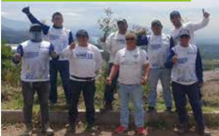
Grupo de voluntarios durante jornada de reforestación en Sigsipamba.

En una jornada de voluntariado, nuestros colaboradores y miembros de la comunidad de Sigsipamba, plantaron 220 árboles nativos en cinco frentes de reforestación. Esta actividad involucró a 20 voluntarios de nuestras tres plantas de Quito, quienes dedicaron cinco horas de trabajo para contribuir al bienestar del entorno y fortalecer nuestros lazos con la comunidad local.