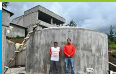
Construcción de tanque cisterna en Sigsipamba.

Este proyecto no solo aborda necesidades básicas, sino que también fomenta la participación y organización comunitaria como motor de desarrollo.