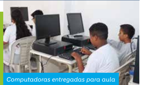
Computadoras entregadas para aula

Este logro fue posible gracias al trabajo en equipo de la comunidad, los padres de familia, la escuela, y los voluntarios de Holcim Ecuador, incluyendo el equipo de planta Loma Alta y de IT, quienes hicieron posible la entrega e instalación de 10 computadoras.