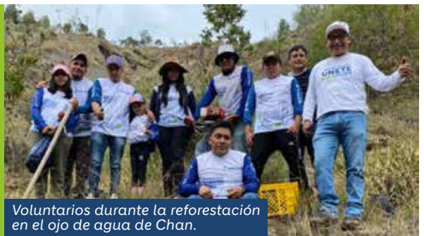
Voluntarios durante la reforestación en el ojo de agua de Chan.

Realizamos una jornada de reforestación en el ojo de agua del barrio Chan, en Latacunga, con el objetivo de proteger el recurso hídrico y fortalecer los ecosistemas locales. Durante esta actividad, se sembraron 420 árboles nativos, beneficiando directamente a alrededor de 1500 habitantes del barrio y a todos los usuarios de esta importante fuente de agua.