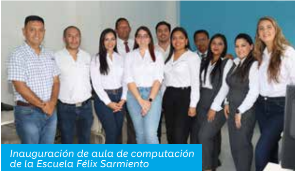
Inauguración de aula de computación de la Escuela Félix Sarmiento

Construimos e inauguramos la primera aula de computación de la Escuela Félix Sarmiento en Sabanilla, vecina de nuestra planta Loma Alta, un proyecto que busca reducir brechas tecnológicas y preparar a los niños con habilidades digitales esenciales para un futuro lleno de oportunidades.