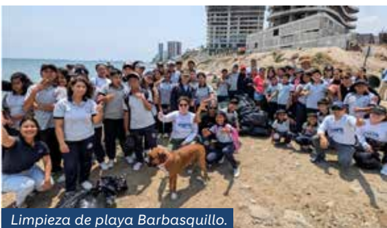
Limpieza de playa Barbasquillo.

Llevamos nuestra metodología de Escuelas Sostenibles a la Escuela Orly Champier en Manta con un taller de 3 días, impartido por nuestro equipo ambiental y de Planta Manabí. Capacitamos a 40 estudiantes en agua, océanos y cuidado ambiental, y culminamos con una limpieza en la playa Barbasquillo, donde más de 50 voluntarios recogimos y clasificamos 60 bolsas de desechos.