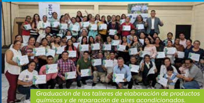
Graduación de los talleres de elaboración de productos químicos y de reparación de aires acondicionados.

Además, hemos consolidado al CEPT como un articulador clave en la comunidad, logrando alianzas estratégicas con el sector académico y de la salud. Esta iniciativa ha beneficiado directamente a más de 400 personas, contribuyendo al desarrollo integral y sostenible de la zona.