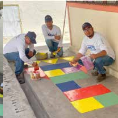
Pintura de juegos didácticos durante jornada de voluntariado.

Con gran entusiasmo, llevamos a cabo una jornada de voluntariado en la escuela Alonso Castillo de la ciudad de Ambato, beneficiando a 280 estudiantes. Contamos con la participación de 18 voluntarios de planta y más de 30 personas de la comunidad, quienes trabajaron con compromiso y dedicación para lograr: Pintar las instalaciones con juegos didácticos y llenando de color los espacios de la escuela; realizar labores de limpieza y barrido, instalar un techo que brinda mayor comodidad y seguridad a los niños.