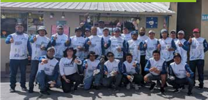
Equipo de voluntarios en Unidad Educativa Luis Roberto Bravo.

Junto a nuestro equipo de planta Cuenca, entregamos materiales y organizamos una minga para mejorar la infraestructura de las aulas y canchas deportivas de la Unidad Educativa Luis Roberto Bravo, vecina a nuestras operaciones, beneficiando a más de 750 alumnos.