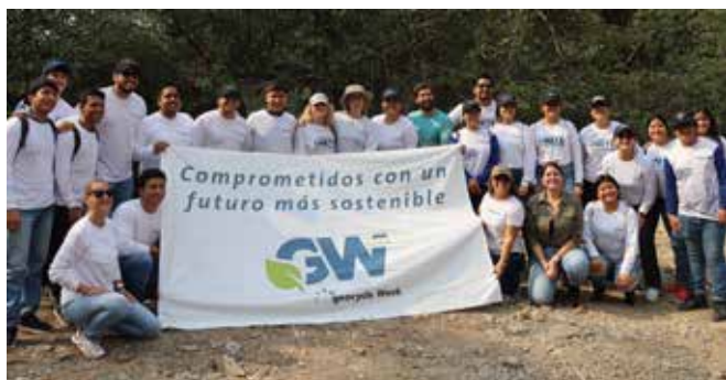
Nuestro equipo de voluntarios en la limpieza del manglar de Puerto Hondo.

Creada en el 2005 como brazo ejecutor de las acciones de responsabilidad social de Holcim Ecuador . Contamos con más de 19 años de experiencia en procesos de desarrollo sostenible .