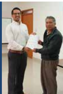
Mejora en casa comunal de Chan y entrega de acta durante CAP.

En colaboración con las comunidades locales y la Fundación Somos, trabajamos en la revitalización de 10 casas comunales alrededor de la Planta Latacunga. Este proyecto busca mejorar la infraestructura, ofrecer talleres de sensibilización y promover el intercambio de experiencias, creando espacios funcionales y acogedores para fomentar el desarrollo y la participación comunitaria.