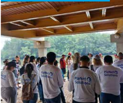
Taller técnico de preservación del manglar.

Junto a The Social Project y la comunidad de Puerto Hondo, presentamos el proyecto Vivero de Mangle , que busca conservar el manglar, proteger la biodiversidad y fortalecer la economía local mediante capacitación y acompañamiento. Con el apoyo de voluntarios, avanzamos en la conservación al recolectar plántulas de mangle, fomentamos la circularidad al recolectar y coprocesar desechos del manglar, y fortalecimos la economía comunitaria al mejorar la infraestructura del vivero, que generará ingresos y promoverá la reforestación.