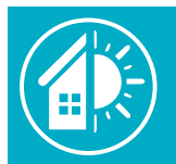
Uso interior y exterior