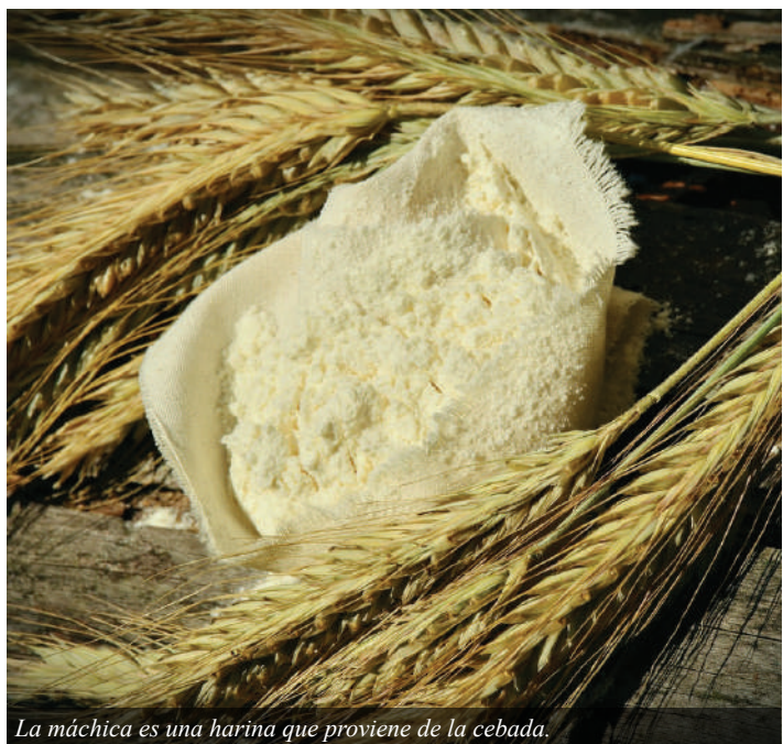
La máchica es una harina que proviene de la cebada.

Primero se llamaba San Felipe, pero el 24 de julio de 1920, esta parroquia cambió su nombre a Eloy Alfaro, mediante una ordenanza municipal, en homenaje a este gran personaje ecuatoriano, también conocido como Viejo Luchador.