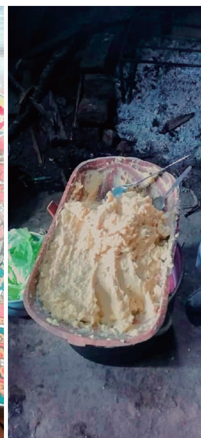
Comida típica de la Semana Santa.

Se dice que la preparación está hecha a base de 12 granos que representan a los apóstoles y las tribus de Israel, mientras que el bacalao representa a Jesucristo.