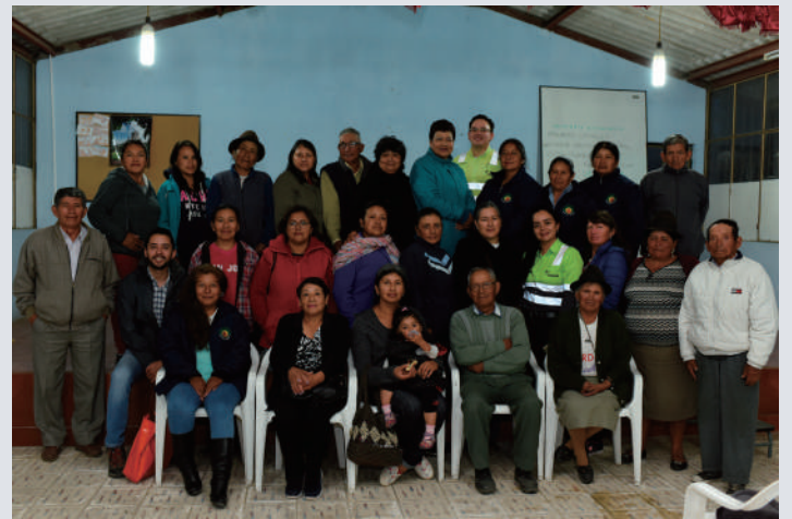
Moradores de las comunidades durante los CAP.

A partir del mes de febrero los Comités de Acción Participativa (CAP) tienen como expositores de los avances de los proyectos comunitarios a los propios vecinos. En las reuniones que se llevan a cabo el último jueves de cada mes, los moradores de los barrios cercanos a la Planta Holcim Latacunga son quienes llevan noticias y comparten experiencias en este espacio.