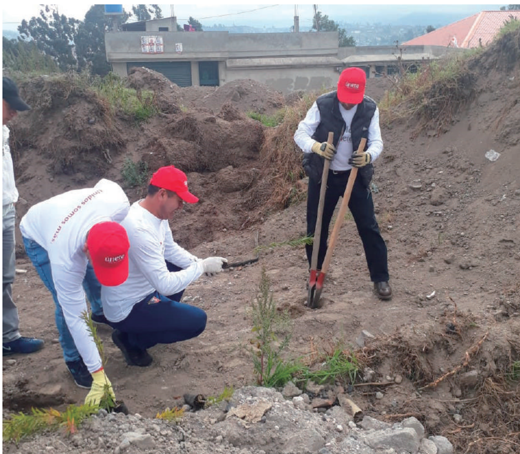
Colaboradores de Holcim durante la jornada de reforestación.

La reforestación, que beneficia a nueve mil personas del sector, brindará sostenibilidad a la tierra para evitar deslizamientos, especialmente en épocas de invierno. Además, los árboles protegen al suelo del impacto erosivo de la lluvia o del viento, con sus copas y ramas. Por lo que, Latacunga también forma parte del movimiento mundial de reforestación. Esta actividad fue parte del programa de voluntariado corporativo Únete, creado por Holcim Ecuador en el 2012, que permite a los colaboradores ofrecer sus recursos, talento y tiempo para trabajar en y con la comunidad en temas de seguridad, ambiente, educación y emprendimiento.